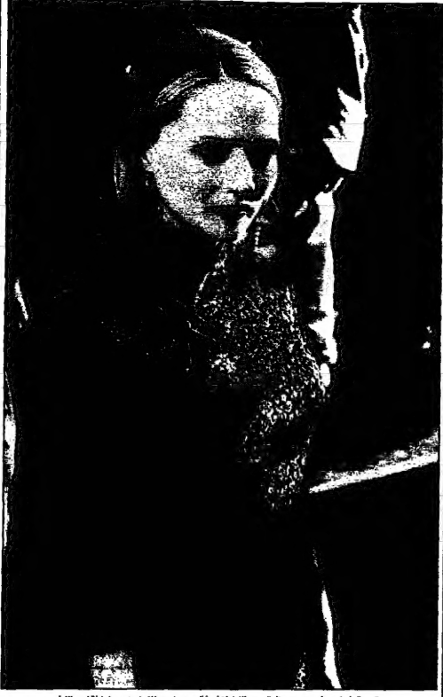
الشيخة مريم بنت راشد آل مهيدي، ابنة عمها، في زيارة الى بيتها في ابوظبي.